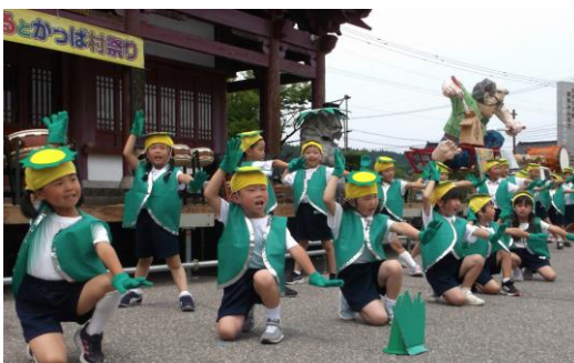
元気いっぱいの園児たち