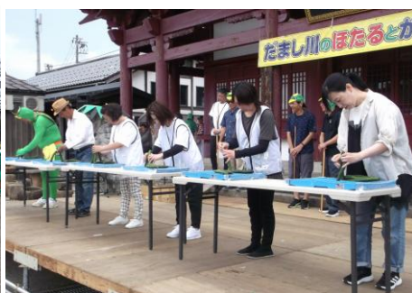
きゅうりの積み上げ大会