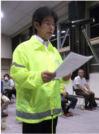
宣誓をする一前自治会長

毎年5月20日を既定日として行われている「青色防犯パトロール車出発式」が24名の参加により開催されました。今年度の青色防犯パトロール車による夜間パトロールは、本日からスタートします。