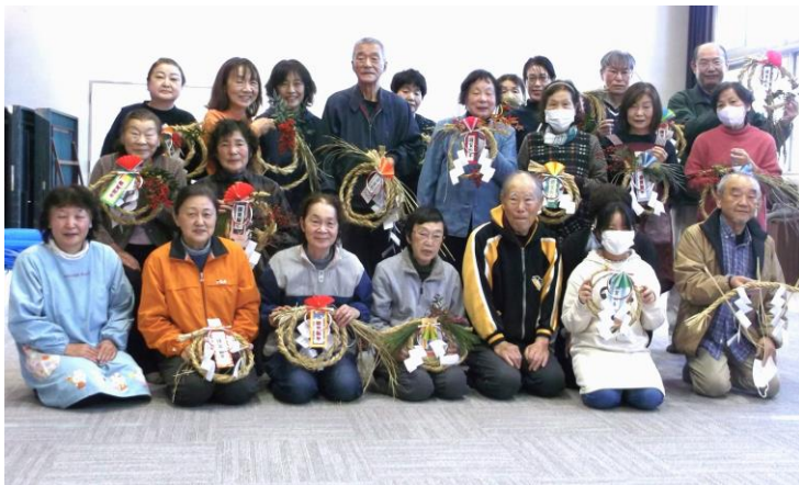
力作の『しめ縄飾り』を完成させ、みんなで写真

「しめ飾り」は、新年に幸運をもたらすと言われる年神様（歳神様）をお迎えし、その加護を受けるために玄関などに飾るのだそうです。