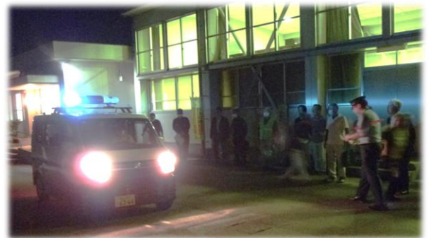
青色防犯パトロール車出発