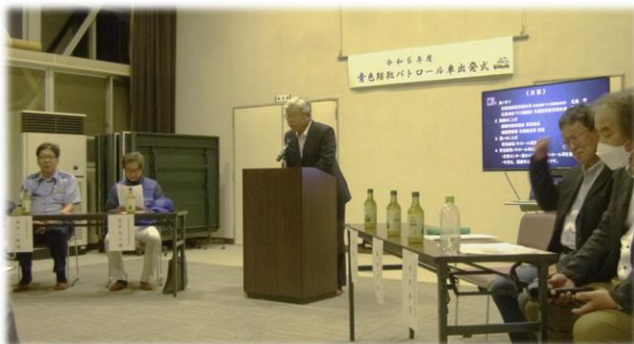
挨拶 北島防犯組合長