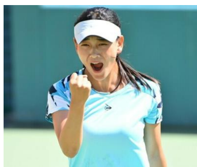
勝利のガッツポーズ!?