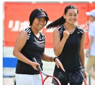
ガッツポーズが可愛い♡♡