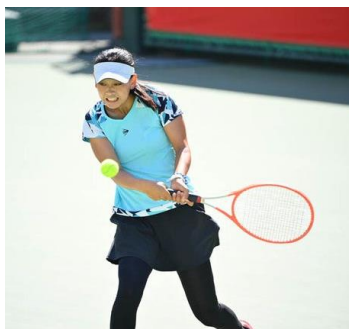
エースのショット!?