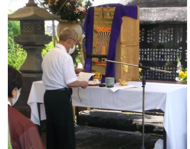
遺族会 小松会長 追悼の辞