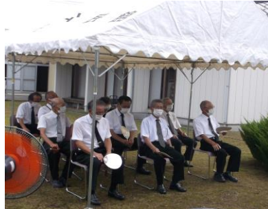
遺族会、一般参列者