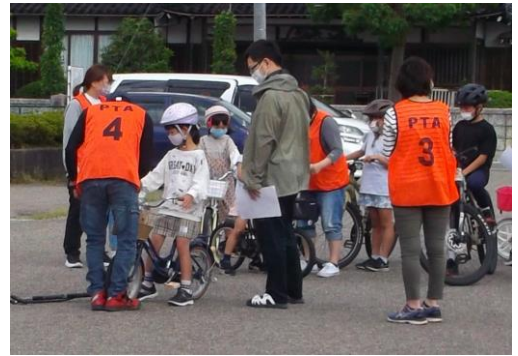
ハンドル・ブレーキ OK!!

今年は非常にたくさんの自転車が集まり、順番を待つくらいでした。これで安心して自転車に乗れますね。大勢の役員の方々に点検してもらい、口には出さないけど、「お父さんお母さん、いつもありがとう。」と言っているようでした。