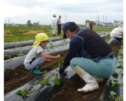
どんぐり保育園園児によるサツマイモの苗植え