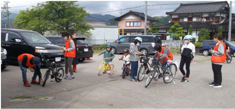
自転車点検中です。空気圧 OK!!