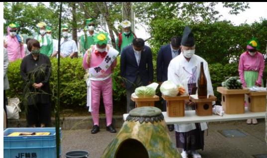
だまし川のかっぱ供養