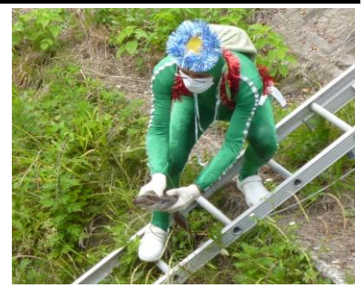
ナマズにお神酒飲ませ放流