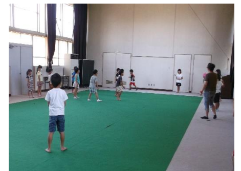
体育の授業(ドッジ)