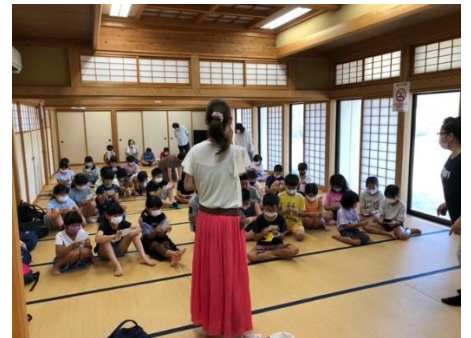
花火争奪ビンゴ大会