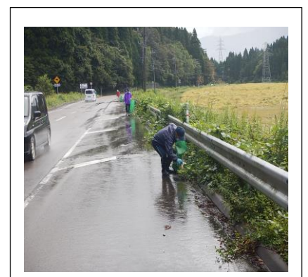
主要地方道金沢井波線